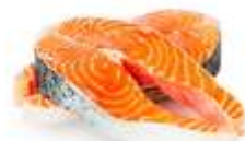
Морская рыба (лосось, сельдь)